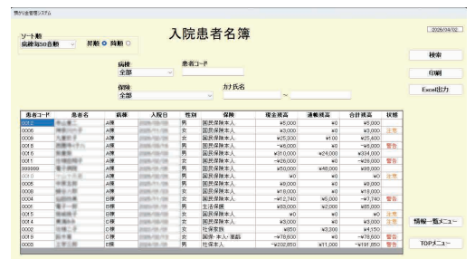
入院患者名簿画面