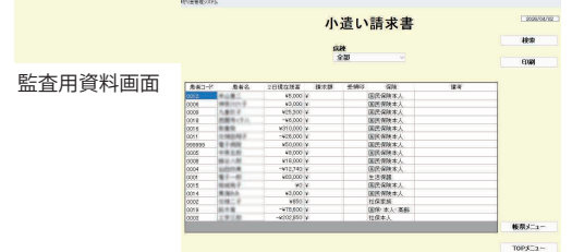
小遣い請求書画面