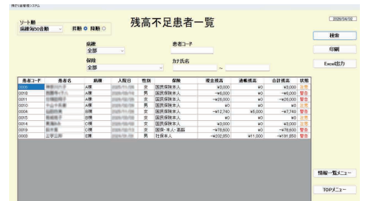
残高不足患者一覧画面