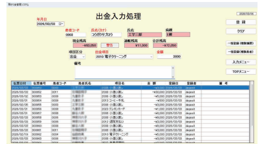
出入金入力処理画面

また、入金や出金登録時に、同じ内容のものであれば複数人一括で登録することができます。個人別に登録するよりも、作業時間を大幅に減らすことができます。